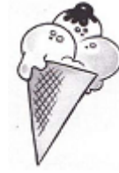
8.ice cr... ..m